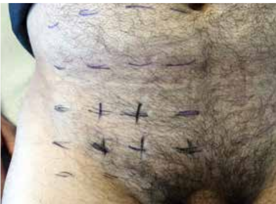
Abbildung 1b: Zustand nach offener Lichtenstein-Operation rechts. Neuropathische Schmerzen im Versorgungsgebiet des N. iliohypogastricus.

(+) Schmerzen, (-) keine Schmerzen, (o) Hyp- oder Anästhesie