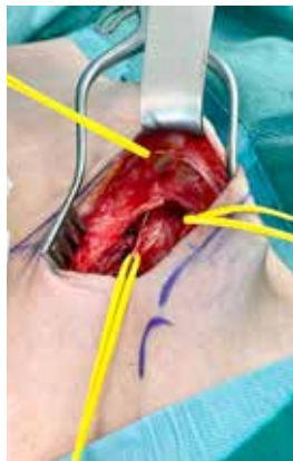
Abbildung 2b: angeschlungener N. iliohypogastricus rechts. Gut zu erkennen ist der mediale Durchtritt des Nerven durch die Externusaponeurose mit nachfolgender Aufzweigung in mehrere Äste.

müssen gezielt gesucht werden. Dazu zählen zum Beispiel Orchalgie, Hüftgelenk-Impingement (FAI), Diskusprolaps der BWS-LWS, andere urologische oder gynäkologische Ursachen sowie Pathologien der Iliopsoas-Gruppe und der Adduktoren.