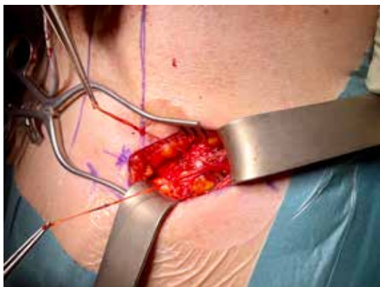
Abbildung 2a: offene Neurektomie der linken Leiste. Gut sichtbar der verzweigte Verlauf des N. ilioinguinalis.