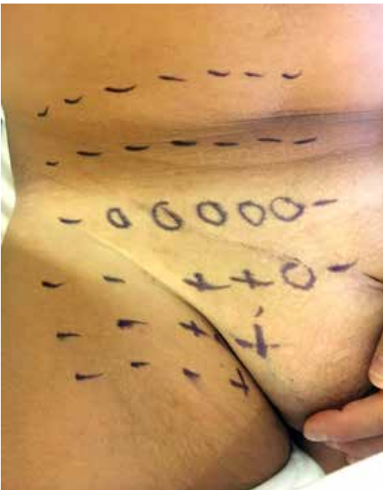
Abbildung 1a: Zustand nach offener Lichtenstein-Operation. Neuropathische Schmerzen im Versorgungsgebiet des N. ilioinguinalis rechts mit Hypästhesie im Versorgungsgebiet des N. iliohypogastricus (Vermutlich infolge einer pragmatischen Neurektomie während der Lichtenstein-Operation).

Schweizerische Arbeitsgruppe für Hernienchirurgie